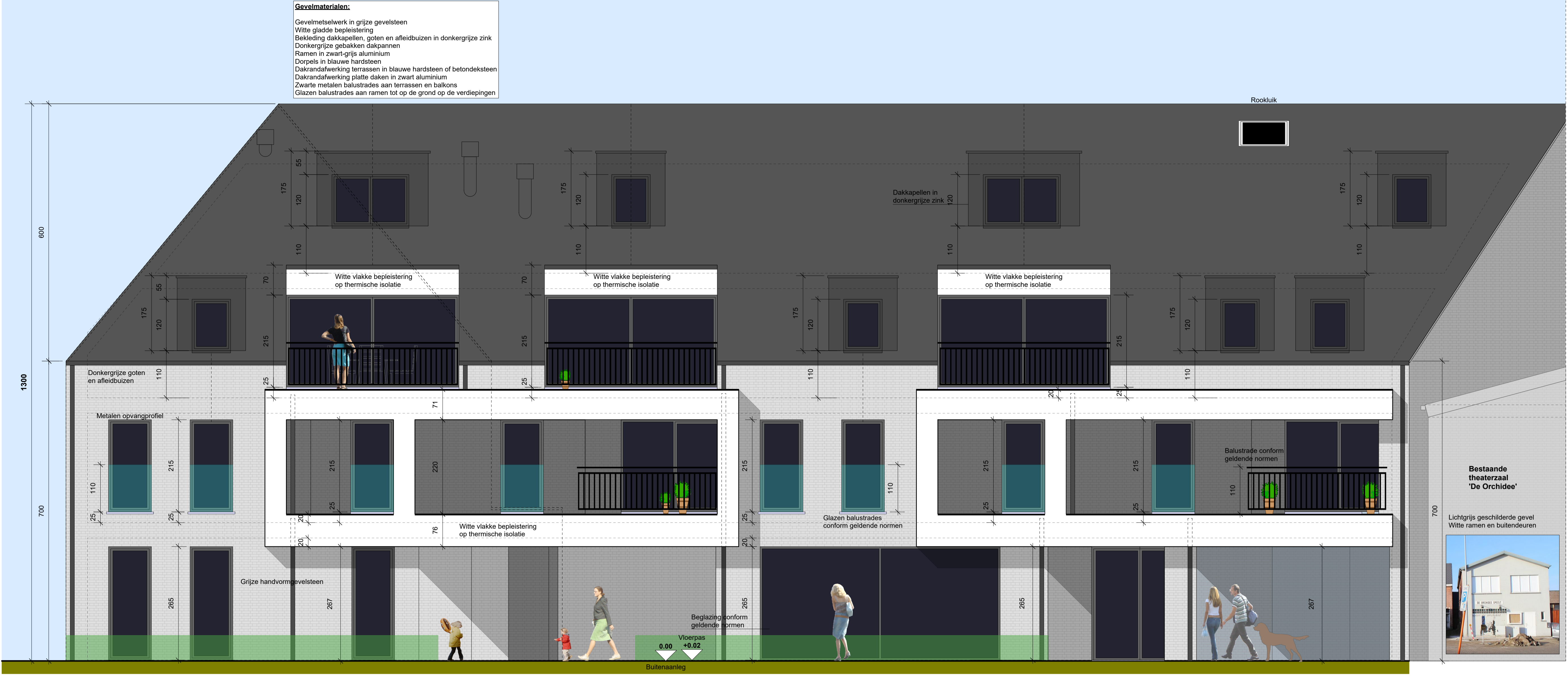
Voorgevelaanzicht schaal 1/50

Gevelmaterialen: Gevelmetselwerk in grijze gevelsteen Witte vlakke bepleistering Bekleding dakkapellen, goeten en afleidbuizen in donkergrijze zink Donkergrijze geïsoleerde dakpannen Ramen in zwerfgrijs aluminium Dorpels in blauwe hardsteen Dakrandafwerking terrassen in blauwe hardsteen of betondeksteen Dakrandafwerking platte daken in zwart aluminium Zware metalen balustrades aan terrassen en balkons Glazen balustrades aan ramen tot op de grond op de verdiepingen