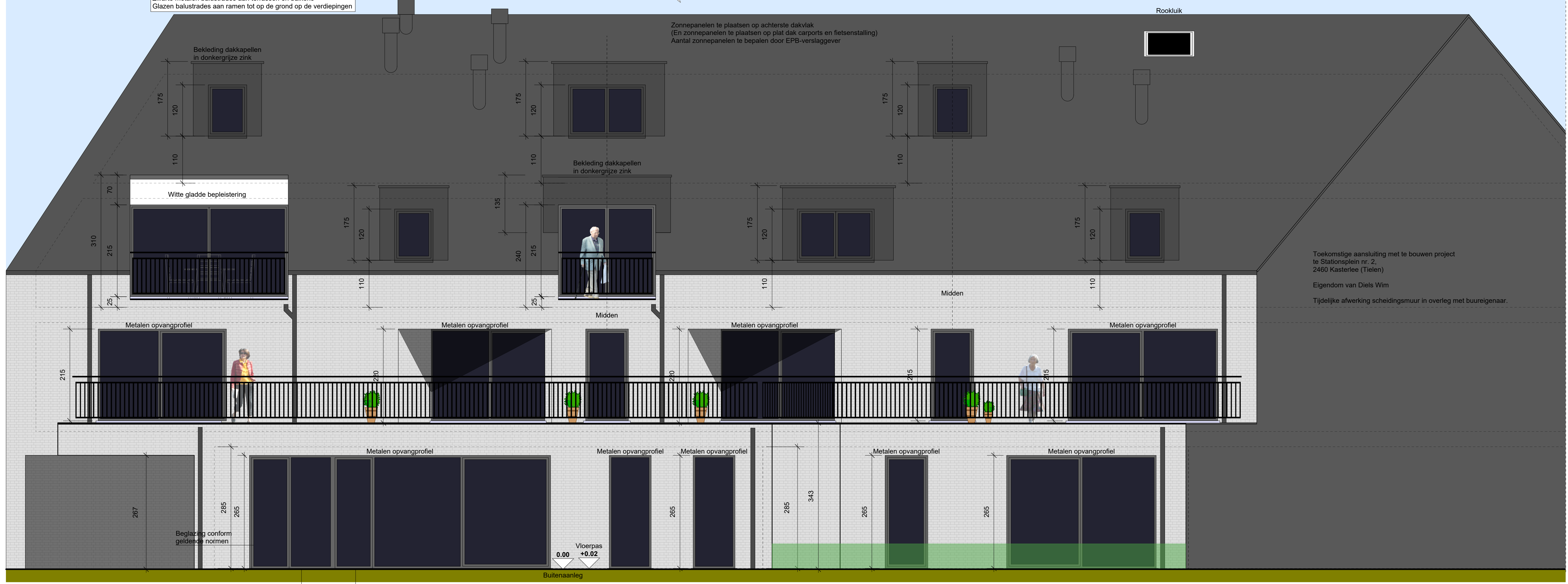
Achtergevelaanzicht schaal 1/50

Zonnepanelen te plaatsen op achterste dakvlak Een zonnepaneel te plaatsen op plat dak carports en fietsenstalling Aerial zonnepanelen te bepalen door EPB-verslaggever